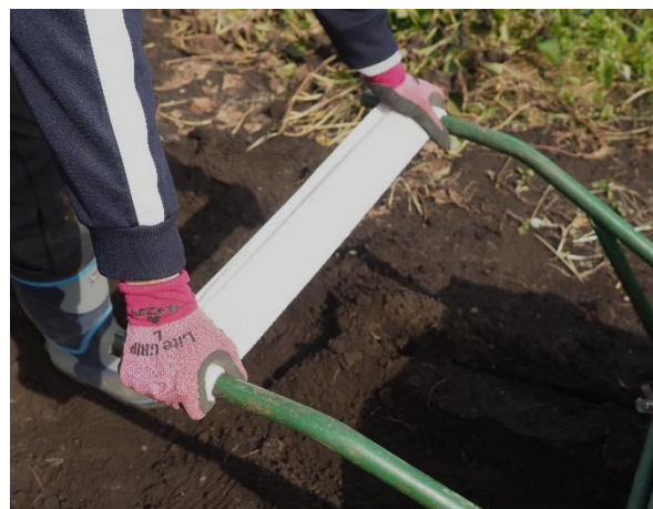
2) タオルの上から、取っ手を握る