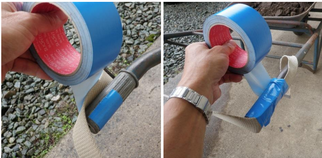
1) 布ガムテープで、左右の取っ手に固定