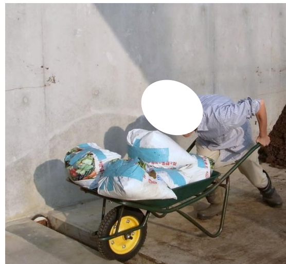
楽押し、なし 腕力で、ムリムリ押して 50 kg