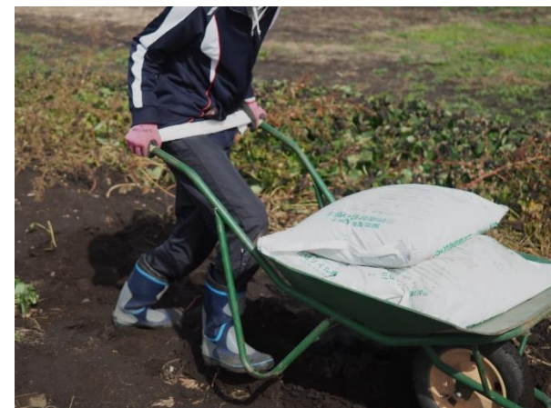
3) 太ももで押して、働く