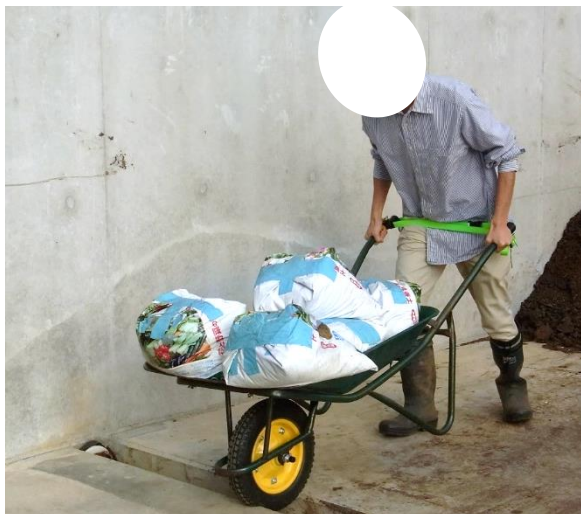
楽押し、あり 太ももで、ひと押し 88 kg