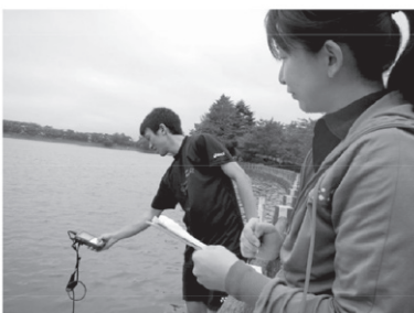
貯水池での水質観測