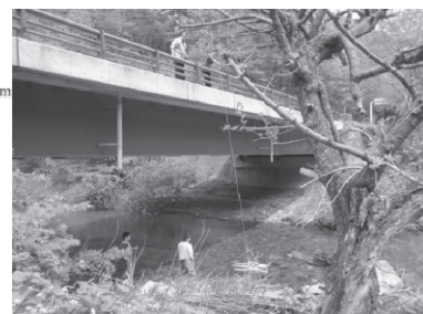
河川での流量観測