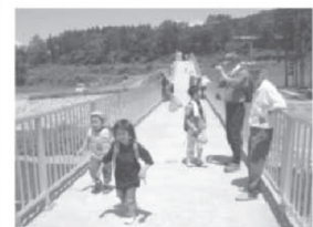
癒しの溪流づくり