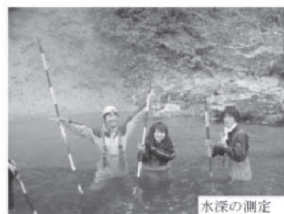
水深の測定 溪流環境の調査