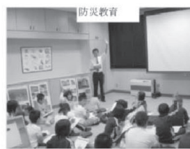
防災教育 災害に強い地域