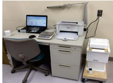
放射性セシウム濃度の測定