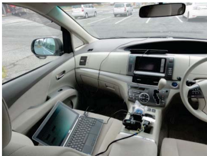
走行サーベイによる線量測定