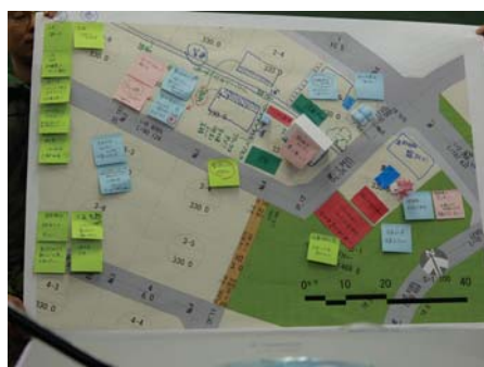
住宅地計画に関する WS の開催とデザイン提案