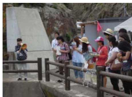
体験交流プログラムの企画提案と実施