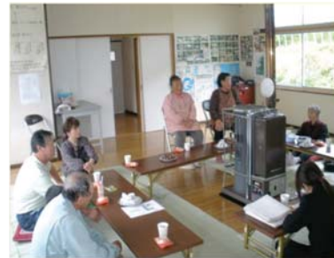
写真-2 住民からの聞き取り調査