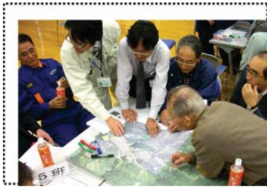
写真-1 ワークショップ・DIG の実践